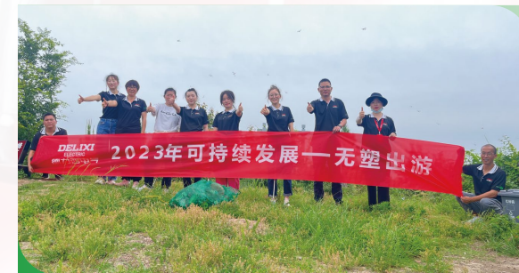
世界健康安全日：让我们一起减塑/捡塑