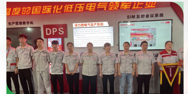
总经理为安全代言，开展安全先进评比