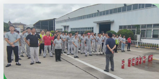
消防应急预案和急救预案演练