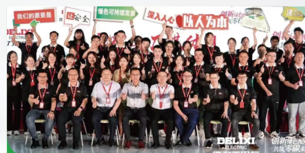
全员参与安全培训&隐患提报