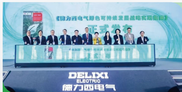
绿色可持续发展实践指南全球发布

2023年，德力西电气正式向全球正式发布“以人为本、促碳中和、建绿色生态圈”的绿色可持续发展战略，继续以“以人为本、零事故、零伤害”为安全主题开展一系列的活动，每天/周/月对生产现场进行安全检查，每月组织不同的可持续发展主题，做到榜样作用、全员参与、与合作单位共赢、践行社会责任。每季度对重大危险源的运行情况进行检查，及时发布检查结果，并对安全隐患的整改情况跟踪验证，每季度组织一次安全先进评比，对安全生产工作中能够表现出色的个人进行安全之星表彰，由工厂总经理在SIM会议上对优秀者进行表彰，同时在园区公示，由这些优秀者分享个人获奖经历以提高榜样力量，推动可持续的安全文化 S.A.F.E First。