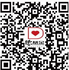
芜湖德基金公益基金会

开户银行：中国建设银行芜湖县支行 开户名称：芜湖德基金公益基金会 银行账号：34050167600800001194